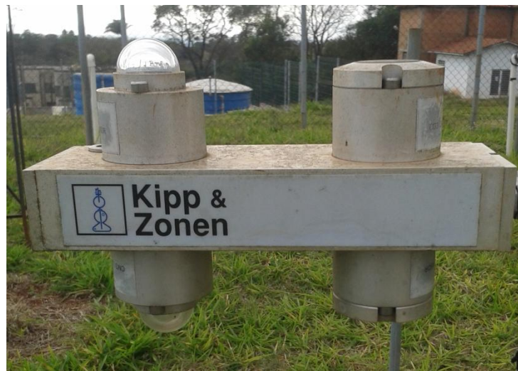
Figura 4- Saldoradiômetro CNR1 Net Radiometer.

Para o acompanhamento dos elementos meteorológicos temperatura e umidade relativa do ar foi utilizado um sensor tipo HMP45C da marca Vaisala. Na aquisição dos dados foi utilizado um datalogger da marca Campbell CR21X, operando na frequência de 0,2 Hz e armazenando médias de 5 minutos ou 300 segundos. Todos os dados passaram por um controle de qualidade para a eliminação de valores incorretos decorrentes de quedas de energia, manutenção e calibração.