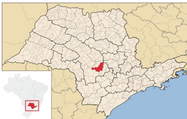
Figura 1- Mapa mostrando a localização do município de Botucatu no estado de São Paulo.

Botucatu ( 22^{\circ}53'09''S ; 48^{\circ}26'42''W e altitude média 786m) é um município brasileiro localizado na região centro-oeste do Estado de São Paulo (Fig. 1), possui área total de 1.482,642 km 2 e população estimada em 2015 de aproximada de 127.308 mil habitantes (IBGE, 2015). O município possui elevado gradiente de altitude, entre 400 a 500 m na região mais baixa (depressão periférica) e entre 700 a 900 na região serrana (Planalto Ocidental). Esta diferença provoca variações na temperatura do ar no município. Distante 221 km do oceano Atlântico e 235 km da Capital São Paulo, com bioma cerrado e de mata atlântica, Botucatu apresenta clima temperado quente (mesotérmico), verão quente e úmido com elevada precipitação e inverno seco (Escobedo et al., 2011).