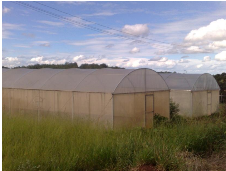
Figura 3- Estufa vista de fora

Para a medida do saldo de radiação foi utilizado um saldo-radiômetro modelo CNR1 Net Radiometer da marca Kipp & Zonen ®. Este aparelho (Fig. 4) tem a capacidade de medir as quatro componentes ao mesmo tempo: tem dois sensores capazes de medir a radiação no espectro de ondas curtas, um medindo a radiação global (voltado para cima) e outro medindo a radiação refletida (voltado para baixo); e dois sensores sensíveis no espectro de ondas longas, um medindo a radiação de onda longa atmosférica (voltado para cima) e outro medindo a radiação de onda longa terrestre (voltado para baixo). O saldoradiômetro foi calibrado, tendo sua medida comparada a outro piranômetro referencial. A calibração foi aferida antes e no final do experimento.