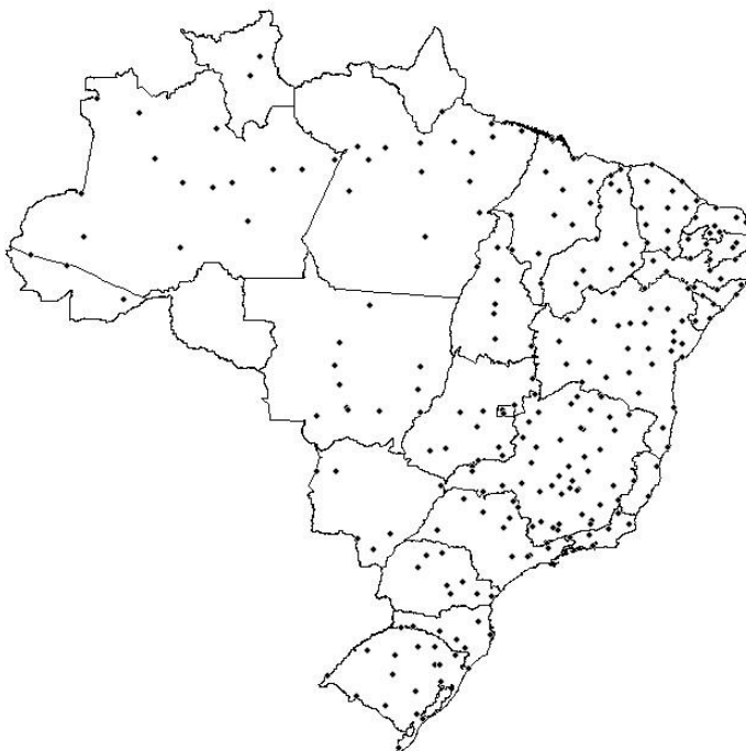
Figura 1- Distribuição geográfica da rede de estações meteorológicas convencionais componentes do BDMEP do Inmet.

O Banco de Dados Meteorológicos para Ensino e Pesquisa – BDMEP disponibilizado pelo Instituto Nacional de Meteorologia – INMET é formado por uma rede de 263 estações meteorológicas convencionais e medições efetuadas de acordo com as normas da Organização Meteorológica Mundial – OMM e contem séries históricas de dados diários a partir de 1961 até 2013. A Fig. 1 mostra a distribuição geográfica da rede de estações no Brasil.