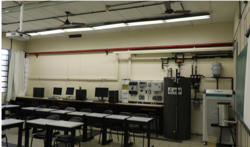
Figura 3 - Sala de controle e monitoramento do CEDER

Ademais, o Centro dispõe de outros equipamentos para a supervisão do sistema (Fig. 3). Esses são: anemômetros, os quais monitoram a velocidade do vento; SensorBox que é empregado no supervisionamento da radiação solar e da temperatura das células dos módulos; sensor de temperatura; Sunny Portal que “é uma plataforma online para monitorização de sistemas, bem como para visualização e apresentação de dados de sistemas” (SMA Solar Technology AG, 2014, p.9). Esse está dividido em duas abas, sendo elas: CEDER Solar e CEDER Wind. O primeiro supervisiona os dados de geração dos módulos monocristalinos e o segundo do aerogerador horizontal. Para acompanhar a produção de cada um desses, são utilizados micro inversores, que se comunicam com o Sunny Multigate enviando suas informações de energia elétrica para a plataforma online. Já o Sunny Webbox , recebe os dados do aerogerador horizontal, do Sunny SensorBox e do anemômetro e, também os envia para a plataforma.