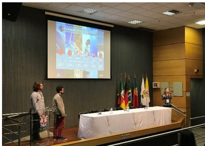
Figura 7 - Palestra Evento 8º Simpósio Brasil-Alemanha de Desenvolvimento Sustentável

Além disso, as tecnologias, estudos e alguns equipamentos do Centro foram explorados para a comunidade em geral na forma de stands . Ao longo do ano de 2017 houve a participação em 3 eventos com este formato, são eles: