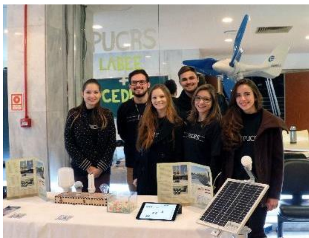
Figura 8 - Participação no Evento Cidade Bem Tratada

6º Seminário Cidade Bem Tratada: Trata-se de um evento pautado pelas discussões acerca dos desafios enfrentados pelo município de Porto Alegre na implementação da Política Nacional de Resíduos Sólidos - PNRS (Lei 12.305/10). Bem como, engloba temáticas voltadas à sustentabilidade e sua aplicação no contexto do município. O evento contemplou palestras ministradas por professores, pesquisadores, gestores de órgãos públicos, entre outros, tal como o de envolver iniciativas sustentáveis de diversas universidades do município e da Região Metropolitana (CIDADE BEM TRATADA, 2017). Sendo assim, a PUCRS participou do evento como apoio acadêmico, no qual os integrantes do CEDER demonstraram as tecnologias existentes no centro (Fig. 8), assim como apresentaram o âmbito das energias renováveis no Brasil e divulgaram os projetos de sustentabilidade promovidos pela Universidade.