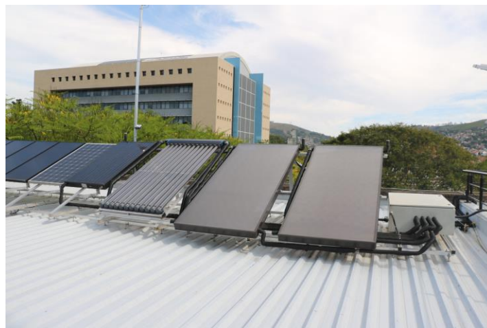
Figura 2 - Terraço CEDER com as tecnologias de aquecimento de água

O sistema de aquecimento de água é composto por três tipos de tecnologias: os coletores termossolares de tubos à vácuo, as planas e a híbrida, todos com inclinação de 22° orientados para o norte. O sistema instalado no local é de circulação forçada, em que a água, desmineralizada, proveniente de um reservatório térmico, com capacidade de 500 litros, é enviada por uma bomba para os coletores solares. Há uma interface de controle que permite direcioná-la para o coletor desejado, acionando ou fechando as válvulas. A água, para consumo, proveniente do Departamento Municipal de Águas e Esgotos (DMAE), passa por uma serpentina interna ao reservatório de água ( boiler ), absorvendo calor e sendo conservada quente em um tanque denominado “chimarródromo”. Estudos quanto a utilização do fluido em uma temperatura pré-determinada, específica, podem ser desenvolvidos devido à facilidade de definição de parâmetros e controle pela interface do sistema, o que permite analisar a eficiência dos coletores solares (Fig. 2).