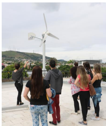
Figura 6 - Visita Técnica ao terraço do CEDER

Para participações de grupos grandes (mais de 4 pessoas), é realizada a palestra do CEDER na sala de monitoramento a fim de introduzir o conhecimento teórico antes das demonstrações. Caso a visita seja feita para pequenos grupos (de até 4 pessoas), a introdução do conhecimento é executada por meio de uma conversação durante a demonstração das tecnologias (Fig. 6).