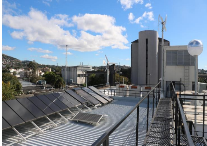
Figura 1 - Terraço CEDER com as tecnologias de geração

inclinação e um acoplado a um tracker system 3 (seguidor solar). Além disso, o Centro possui vinte módulos de filmes finos com potência de 105 Wp cada, posicionados à 22° para o norte e, também, um módulo híbrido monocristalino com capacidade de gerar energia elétrica e aquecer água simultaneamente, com potência de 180 Wp e orientado para o norte com inclinação de 22°. Eles estão distribuídos dessa forma (Fig. 1), a fim de agregar diversidade de pesquisa, ou seja, para que se possa comparar a produção energética dos módulos sob diferentes orientações, condições climáticas e efeitos da sazonalidade. Assim, analisa-se a eficiência da produção de eletricidade.